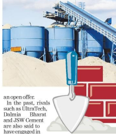
Shree Cement has a production capacity of 6.1M MT per annum

Commercial terms could vary depending on the outcome of due diligence. The talks could end up being inconclusive. The EV of ₹6,000 crore includes debt of ₹1,000 crore. This places the equity value being discussed at ₹4,200 crore. At this valuation, Shree Cement could fork out between ₹1,800 crore and ₹3,224 crore for the quantum of equity stake being discussed if a deal were to work out, not including the cost of