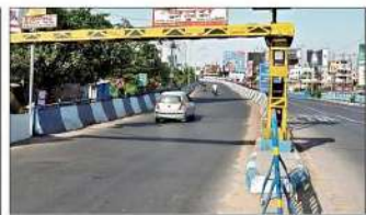
চিৎড়াবাটা চাইবাজার ফ্লাইওভারের কাজের দৃশ্য।

কলকাতা হাইকোর্টের বিচার বিভাগের সিনিয়র জজ পঞ্চায়েত-মামলার ডিভিশন বেঞ্চার রায়ে পঞ্চায়েত-মামলার ভাগ্য প্রশ্নে।