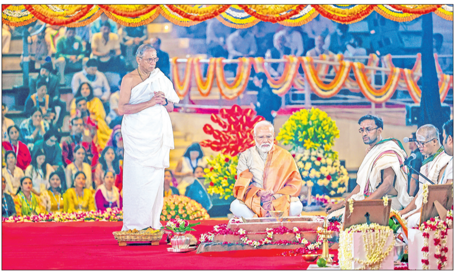
নয়াদিল্লির প্রগতি ময়দানে ইন্টারন্যাশনাল এগজিভিভন নাম কনভেনশন সেন্টার (আইইসিসি) উদ্বোধন অনুষ্ঠানে যাক্তে অংশ নিলেন প্রধানমন্ত্রী নরেন্দ্র মোদি। বৃহবার।

হলে জোর করে মনোনয়ন প্রত্যাহার করানো হয় বহু আসনে। চতুর্থ, মনোনয়ন প্রত্যাহার করতে বার্থ হলে প্রশাসন ক্ষুটিটির সময় তা বাতিল করেছে। আর শেষে জয়ী প্রার্থীদের সার্টিফিকেট আটকে রাখা হয়েছে। তৃণমূল যোগ দিলে তাইই প্রশাসন জুরে সার্টিফিকেট দেবেই বলে দাবি তথ্য অনুসন্ধান দলের। এত কিছুই পরও বিজেপি যত সংখ্যক আসনে জয়ী হয়েছে তাতে তাঁরা সন্তুষ্ট হলে জানান রবিশঙ্কর। গোটা পঞ্চায়েত নির্বাচনে পুলিশ ও প্রশাসন শাসকদলের হয়ে করা হয়েছে। নির্বাচনের পর থেকেই যে দাবিতে সরব ছিলেন বঙ্গ বিজেপির বড়, ছোট, মেজ নেতারা। বিষয়টি প্রশাসনিক। তাই ৩৫৫ দাবি কখনোই বলে জানান তথ্য অনুসন্ধান দলের প্রধান রবিশঙ্কর প্রসাদ। সেইসঙ্গে পাঁচ দফা অভিযোগ করা হয়। রিপোর্টে দাবি, প্রথমত, বিরোধীদের মনোনয়ন জমা করতে বাধা দিয়েছে শাসকদল। দ্বিতীয়ত, বাধা অতিক্রম করে মনোনয়ন দাখিল করলেও প্রচার করতে দেওয়া হয় না বলে হুমকি দেওয়া হয়। তৃতীয়ত, বাধা অতিক্রম করে মনোনয়ন দাখিল করলেও প্রচার করতে দেওয়া হয় না বলে হুমকি দেওয়া হয়।