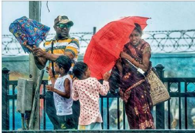
কলকাতা হাইকোর্টের বিচার বিভাগের সিনিয়র জজ পঞ্চায়েত-মামলার ডিভিশন বেঞ্চার রায়ে পঞ্চায়েত-মামলার ভাগ্য প্রশ্নে।

এই সময়: কলকাতা হাইকোর্টের বিচার বিভাগের সিনিয়র জজ পঞ্চায়েত-মামলার ডিভিশন বেঞ্চার রায়ে পঞ্চায়েত-মামলার ভাগ্য প্রশ্নে।