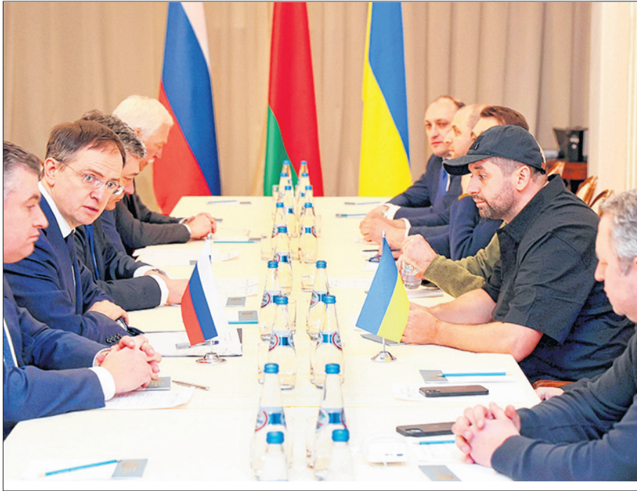
বেলারুশ সীমান্তে গোমেল শহরে ‘শান্তি আলোচনা’য় রুশ ও ইউক্রেন প্রতিনিধিরা। সোমবার।